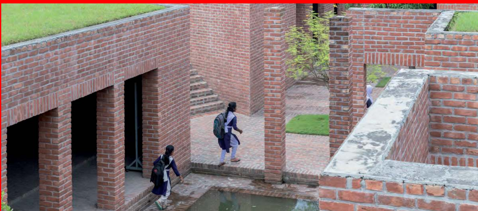
Friendship Centre, Gaibhanda; Architect: URBANA / Kashef Mahboob Chowdhury

Bangladesh's architectural world is masala (Bengali মাসালা) — an intoxicating mixture of contrasts. In the delta region, it is not only the boundaries between land and water that are blurred. Past and present merge anew. An enduring witness to this is the architecture, as the exhibition of 60 projects by established and young Bengali architects shows. Bamboo structures from the past meet monumental walls of béton brut, while Bengali latticework ornaments (jali) originally made from brick transform into semitransparent fabric. This oscillation between local and international influences was already apparent in the modern movement in the Ganges Delta. Hence, there are significant traces of Louis I. Kahn to be detected in the oeuvre of local protagonist Muzharul Islam, which can be seen in original drawings. An exhibition by the SAM Swiss Architecture Museum, produced in collaboration with the Bengal Institute for Architecture, Landscapes and Settlements, Dhaka.