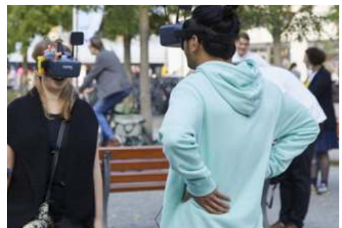
Agentur des städtischen Wandels, Braubachstrasse Aktionstag Post-Corona-Innenstadt Frankfurt