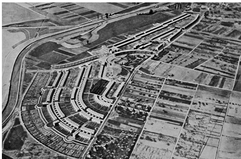
Abb.: Historisches Luftbild der Siedlung Frankfurt-Römerstadt, ca. 1930

Neben Beiträgen aus Architekturgeschichte und Denkmalpflege, wird die Veranstaltung auch mit Positionen aus Kunst, Film und Musik vertieft sowie durch studentische Arbeiten ergänzt.